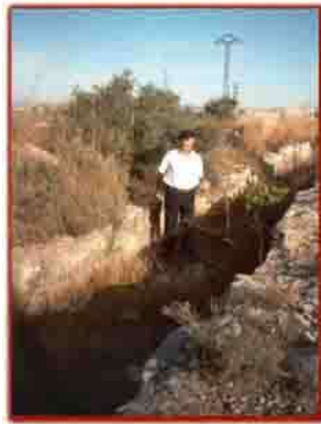
RECUPERACIÓN ARQUEOLÓGICA DEL CANAL DE SAGUNTO, TRAMO ORIGINAL EN LA POBLA DE VALLBONA, S. II A. DE. C..

En Benaguacil, del canal principal se abrieron cuatro Almenaras que dieron lugar a las cuatro acequias que riegan los términos de Benaguacil y la Poble. Para atender el regadío que antes sirviera el Canal de Sagunto, ahora se construye una nueva presa y acequia tomando ésta el nombre que hoy conocemos como Acequia de Moncada, que parte del término de Paterna. Los administradores que antes atendieran el canal de Sagunto quedan en el pueblo mozárabe de la Poble de Benaguacil y los de los azudes que se construyen río abajo quedan en la mezquita de Valencia.