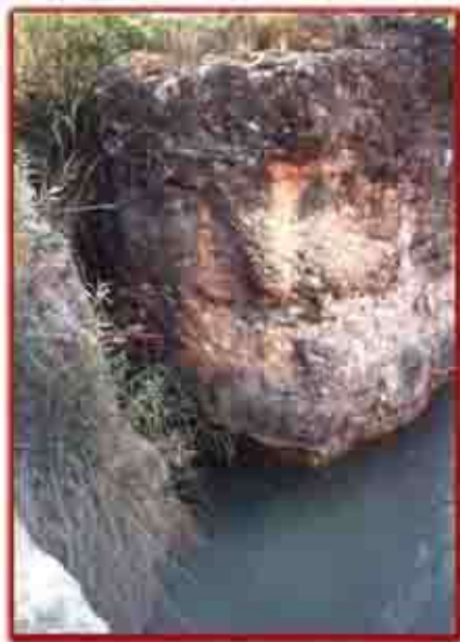
PRIMITIVO CANAL DE SAGUNTO. TRAMO ORIGINAL EN EL AZUD. PEDRALBA, S. II A. DE. C.

Mientras los edetanos viven con armonía su existir, los pueblos de su entorno crecen, comercian y compiten. Los que más destacan en estas cosas son los egipcios, griegos, cartagineses y romanos. También en ese tiempo había otros pueblos adelantados, pero dada la lejanía de sus continentes, su influencia no les alcanza.