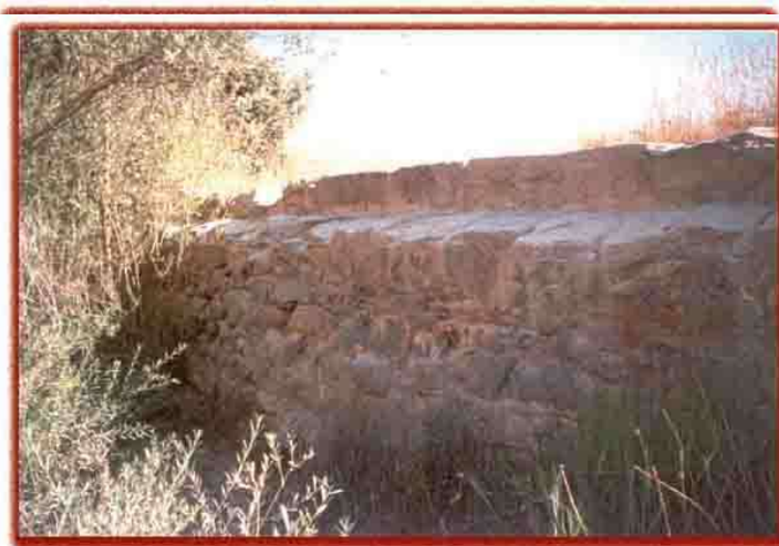
CANAL DE LA COVATELLA, AÚN EN USO, A SU PASO POR LA RAMBLA CASTELLARDA. S. II A. DE C.

Debido a la intervención de Primo de Ribera, las acequias que configuraban el Tribunal así como la de Moncada se agruparon en un sindicato único de regantes. Siendo las representaciones sindicales los órganos que según sus estatutos, deberían ser los administradores generales de las aguas y recursos del río Turia, cuando las obras del pantano terminaran. Sin embargo a dichos sindicatos, el poder central nunca, ni durante las épocas Republicana, Franquista, ni tampoco la monárquica posterior, de Juan Carlos I de Borbón, les dio la responsabilidad que les correspondía.