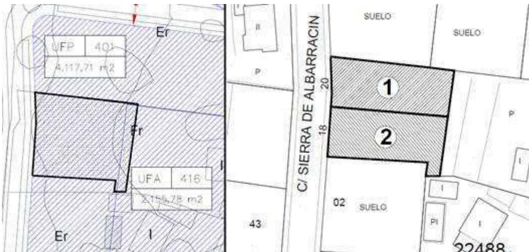
Propuesta de segregación

I.2.- Visto informe DESFAVORABLE del Arquitecto Municipal, de fecha 29 de abril de 2020, que es del siguiente tenor: