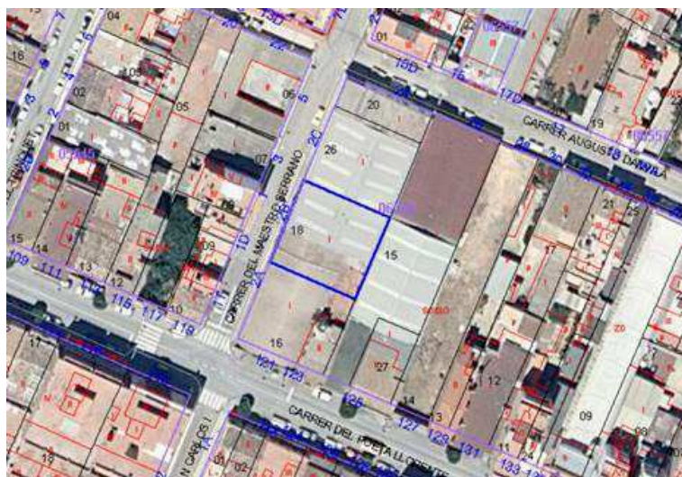
Emplazamiento de la parcela Imagen Sede Electrónica de Catastro

«Con fecha 12/11/2020 (nº R.E. 22152, expediente 5464/2020 2.6.6.1), por [REDACTED] en representación de [REDACTED], con NIF: [REDACTED], presentó en este ayuntamiento solicitud de licencia urbanística para el DERRIBO DE EDIFICACIÓN EXISTENTE , en C/ [REDACTED] Referencia Catastral: 0654618YJ2805S0001ID