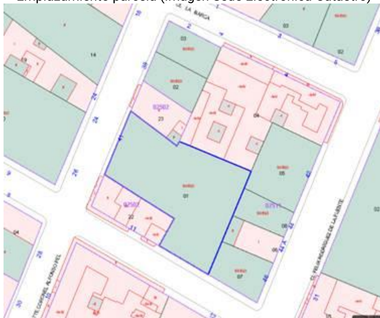
Emplazamiento parcela (Imagen Sede Electrónica Catastro)

I.2.- Se justifica el cumplimiento de la normativa urbanística aplicable a cada parcela mediante plano, siendo las parcelas de resultado las siguientes: